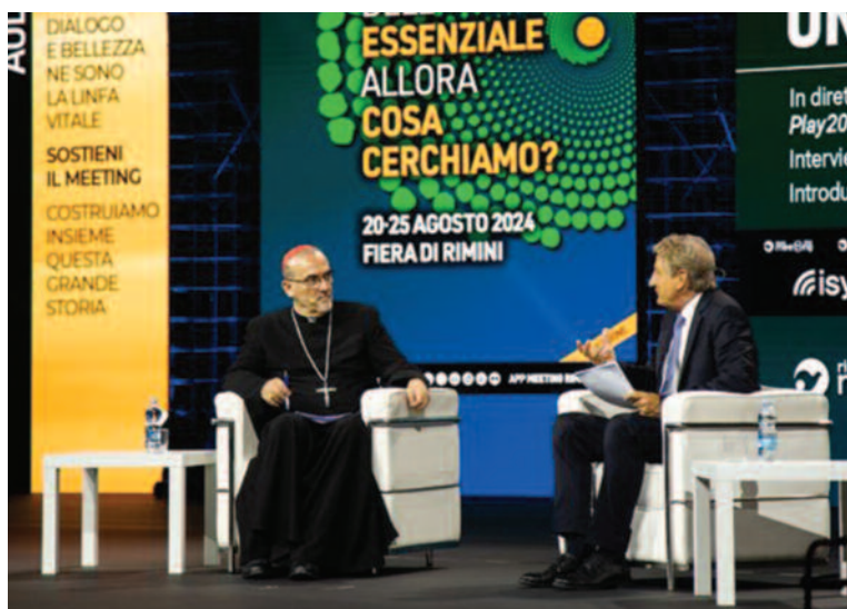
Il Cardinale Pizzaballa ha parlato della situazione in Terra Santa durante il Meeting per l'Amicizia tra i Popoli, che si è tenuto a Rimini la scorsa estate.

Infine, il Patriarca guarda all'interno del