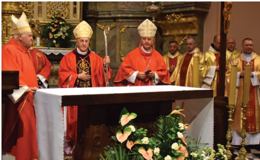
Messa a Miechów presieduta dal Gran Maestro dell'Ordine.

Basilica di Miechów è un luogo sacro che invita a riflettere sul mistero della nostra Redenzione; è una meditazione permanente sul mistero della Morte e Risurrezione del Signore e, liturgicamente parlando, lo è ancora di più nel giorno in cui la Chiesa celebra la festa dell'Esaltazione della Santa Croce», ha affermato all'inizio della sua omelia. Alla presenza dei membri della Luogotenenza polacca dell'Ordine e di tutti i partecipanti alle Giornate di Gerusalemme, che dal 2010 si svolgono ogni due anni in questa città con l'intento speciale di pregare per la Terra Santa, il Gran Maestro ha continuato: «Da quando la fede nel Risorto, il Figlio di Dio, è stata predicata in questa nobile terra di Polonia, Dio stesso ha gettato il suo sguardo benevolo su coloro che la abitano. Storicamente, con la diffusione della venerazione del Santo Sepolcro nella Miechów del XVI secolo, si è voluta riprodurre l'Edicola della Tomba di Cristo. In realtà, il Santo Sepolcro del Signore non rappresenta uno dei tanti luoghi, pur significativi, della vita di Gesù, ma il luogo simbolico che racchiude il mistero della dolorosa Passione e della gloriosa Risurrezione; il luogo dove tutta la missione di Cristo ha trovato il suo compimento, come Gesù stesso affermò: "Se il granello di frumento caduto in terra non muore, rimane solo, ma, se muore, produce molto frutto" (Gv 12,24)».