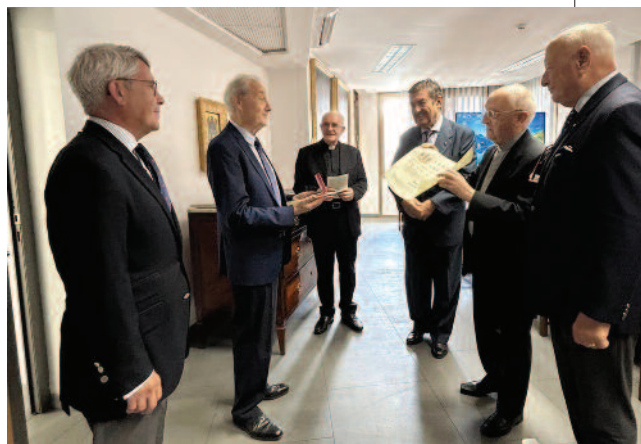
Il Luogotenente d'Onore per la Francia è stato insignito della Palma d'Oro a Roma dal Gran Maestro, alla presenza del Governatore Generale.