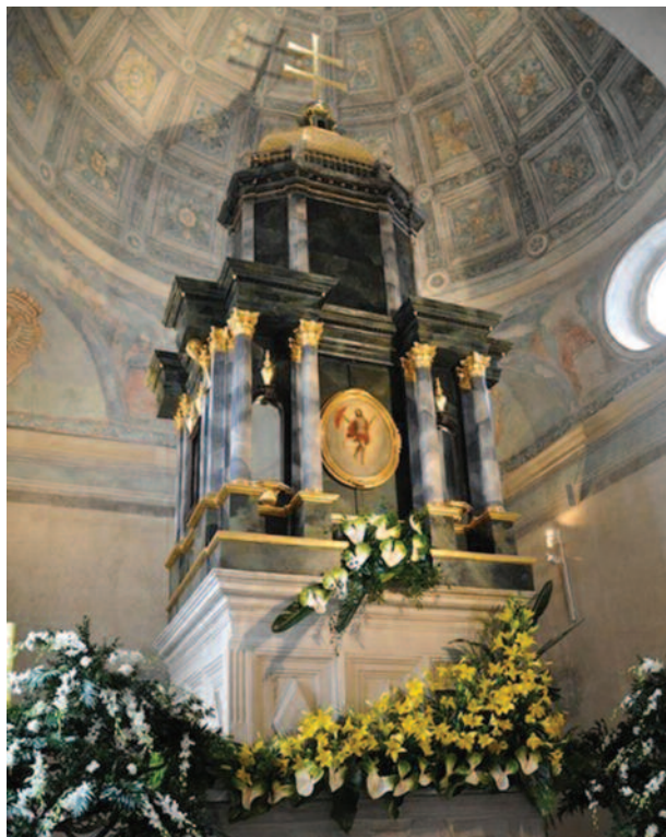
La riproduzione dell'Edicola del Santo Sepolcro in Polonia, che risale al XVI secolo, è al centro di un importante pellegrinaggio che si svolge ogni due anni.

Le Giornate di Gerusalemme si sono celebrate quest'anno in corrispondenza della festa dell'Esaltazione della Santa Croce, particolarmente cara ai membri dell'Ordine e presieduta dal Cardinale Filoni. «Da secoli la