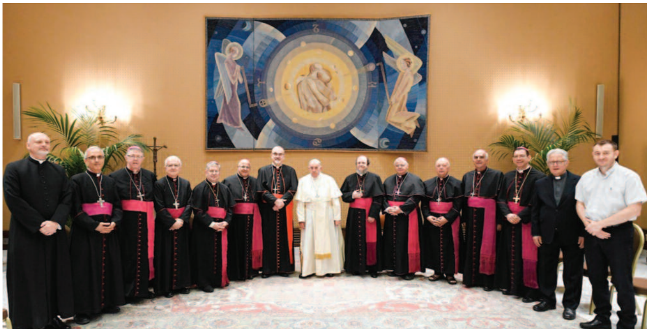
Foto di famiglia al termine dell'incontro con il Papa dei Vescovi della CELRA, presieduto dal Cardinale Pierbattista Pizzaballa, Patriarca Latino di Gerusalemme e Gran Priore dell'Ordine.

sfociano in scontri aperti e lampi di guerra. Il conflitto, invece di trovare un'equa soluzione, sembra diventare cronico, col rischio che si estenda fino a incendiare l'intera regione. Questa situazione ha causato migliaia e migliaia di morti, distruzioni enormi, con immani sofferenze e il diffondersi di senti-