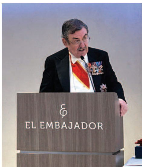
Il Governatore Generale a Santo Domingo, in occasione della fondazione dell'Ordine nei Caraibi, la scorsa primavera.

Di tale processo hanno beneficiato soprattutto le Luogotenenze di medie e piccole dimensioni o quelle geograficamente più isolate che, affiancandosi all'esperienza di Luogotenenze più strutturate e con maggiore proiezione internazionale, ne hanno tratto insegnamenti, sostegno e spunti di riflessione. Si sono vissute quindi interessanti esperienze di Cerimonie condivise fra più Luogotenenze della stessa area geografica, incontri e tavole rotonde, pellegrinaggi congiunti in Terra Santa o in altri suggestivi