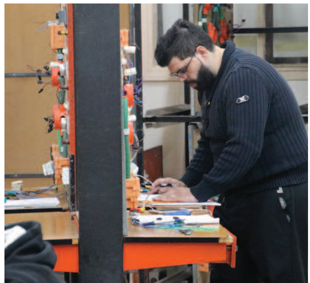
I tirocini retribuiti per i giovani in Terra Santa sono finanziati grazie al sostegno dell'Ordine.

Questo sostegno ha alleviato molti oneri finanziari per coloro che erano disoccupati, avevano perso il lavoro o rischiavano di per-