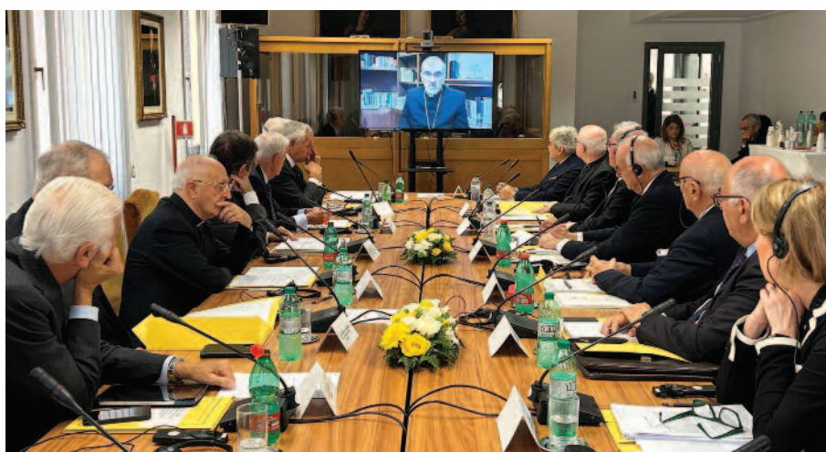
Il Patriarca di Gerusalemme, trattenuto in Terra Santa, si è rivolto ai partecipanti alla riunione attraverso un videomessaggio, ringraziando l'Ordine innanzitutto per il suo sostegno morale e spirituale.

Il Patriarca di Gerusalemme, trattenuto in Terra Santa, si è rivolto ai partecipanti attraverso un videomessaggio, ringraziando innanzitutto l'Ordine per il suo sostegno morale e spirituale - «abbiamo bisogno della vostra preghiera» - e anche facendo riferimento alla bellissima lettera del Papa ai cattolici del Medio Oriente , pubblicata il 7 ottobre, nella quale il Santo Padre ha invocato la Regina della pace ed ha affermato che «preghiera e digiuno sono le armi dell'amore che cambiano la storia».